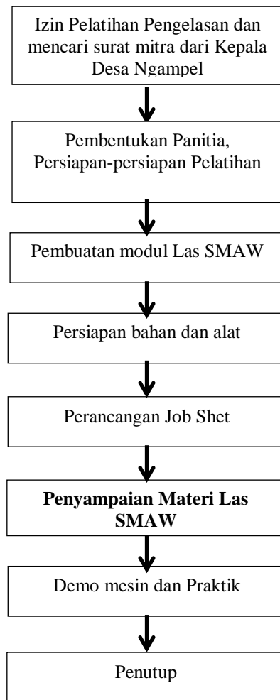
Gambar 2 Diagram Alir Pengabdian Masyarakat

Langkah – langkah kegiatan pengabdian masyarakat ini bisa dijelaskan pada diagram alir dibawah ini.