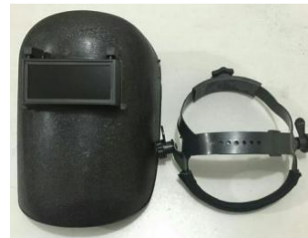
Gambar 7. Topeng Las

Sarung tangan las berfungsi untuk memegang benda kerja yang akan dilas, supaya tangan tidak panas dan percikan bunga api las.