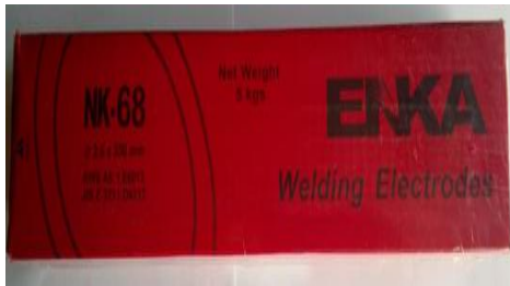
Gambar 10. Elektroda Las

Plat digunakan sebagai media pengelasan.