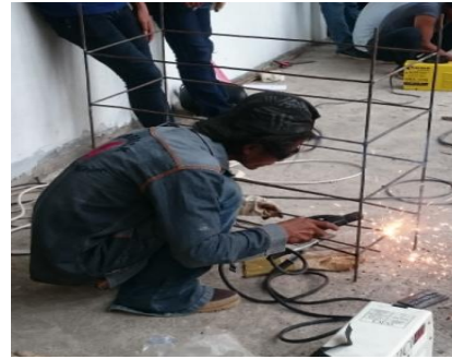
Gambar 14. Pengelasan Rak Sepatu