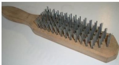
Gambar 5. Sikat Baja Las

Gergaji besi berfungsi untuk memotong material logam ferrous yang akan dilas.