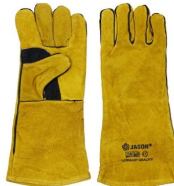
Gambar 6. Sarung Tangan Las

Sikat baja las berfungsi untuk membersihkan kampuh las dari kotoran terak dengan cara digosok