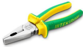
Gambar 2. Tang

Tang berfungsi untuk memegang benda panas setelah hasil pengelasan