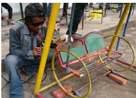
Gambar 13. Pengelasan Ayunan