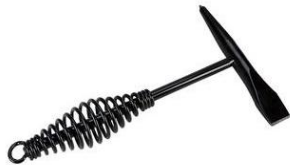
Gambar 3. Palu Las

Tang berfungsi untuk memegang benda panas setelah hasil pengelasan