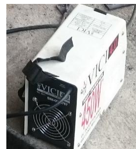
Gambar 1. Las SMAW

2.1 Alat yang digunakan dalam pengabdian ini antara lain: mesin las SMAW, tang las, palu las, gergaji tangan, sikat las, sarung tangan las, kaca mata las atau topeng las, gerinda tangan. Berikut gambar alat beserta kegunaannya