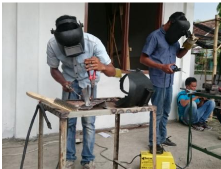
Gambar 12. Pembuatan sambungan las