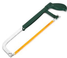
Gambar 4. Gergaji Besi

Palu las berfungsi untuk membersihkan kotoran las atau terak las dengan cara dipukul.