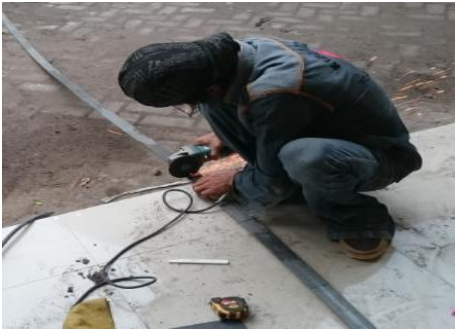
Gambar 11. Proses pemotongan bahan