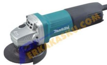
Gambar 8. Gerinda Tangan

Topeng las digunakan untuk melindungi mata dari cahaya las.