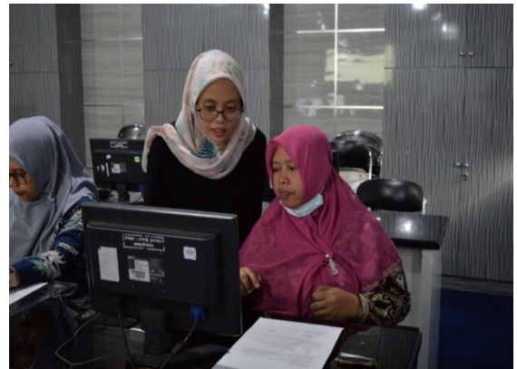
Gambar 2. Penyampaian Materi dan Praktek IT

Jika dilihat dari permasalahan mitra sebenarnya untuk keinginan belajar IT sudah ada namun terkendala kurangnya praktek dalam IT dan tidak semua orang mempunyai laptop ataupun computer. Indikator keberhasilan kegiatan PkM ini juga dapat dilihat dari hasil tes dan diskusi, sekitar 70 persen sudah mampu membuat surat meskipun belum sempurna. Sisanya mampu membuat namun tidak sampai selesai karena memang baru pertama kali belajar IT sehingga butuh waktu yang lebih panjang untuk mengerjakan. Namun, jika dihitung jumlah peserta yang berhasil menyelesaikan tes sampai tuntas maka tampaknya pelatihan dan pendampingan ini masih tetap relevan untuk dilaksanakan di masa-masa yang akan datang sehingga semakin banyak ibu-ibu, terutama ibu-ibu Muslimat NU kota Malang dapat memenuhi melakukan kegiatan administratif dengan lebih mudah.