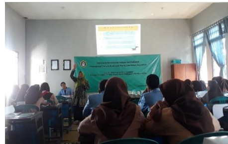
Gambar 2 Pemateri memberikan sosialisasi kepada siswa SMK Palapa Ngoro