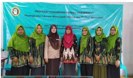
Gambar 1 Pemateri bersama dengan Kepala Sekolah SMK Palapa Ngoro, Jombang