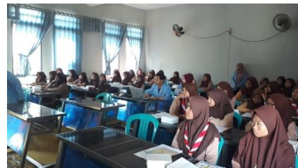
Gambar 3 Siswa SMK Palapa Ngoro antusias mendengarkan materi sosialisasi